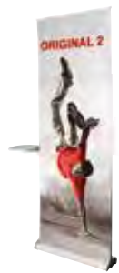
Original 2 avec Option Tablette