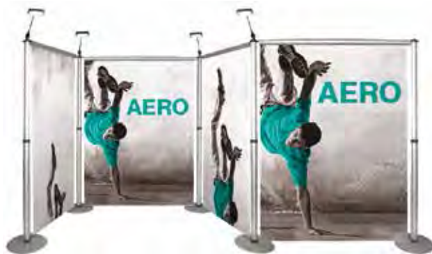
4 Enrouleurs Aero 1500mm - 5 mâts - 5 pieds - Spots en option (voir page 84)

Le Plus de l'AERO : de multiples configurations sont envisageables. Quelques exemples possibles :