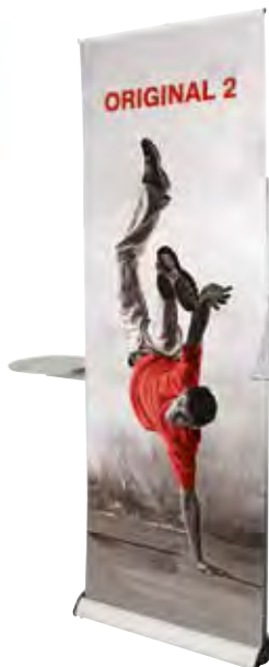
Original 2 avec : Options Tablette et Porte-Document