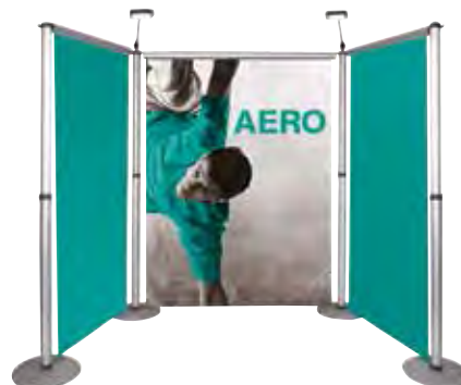
3 Enrouleurs Aero 2000mm - 4 mâts - 4 pieds - Spots en option (voir page 84)