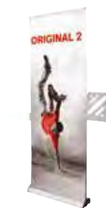
Original 2 avec Option Porte-Document