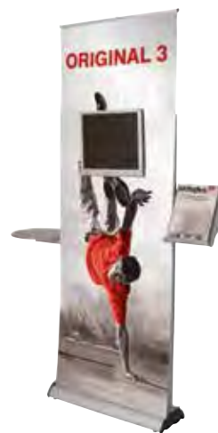
Original 3 comprenant les options : - Porte-écran - Tablette seule - Porte-document seul