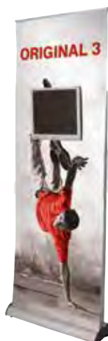
Original 3 avec Option Porte-écran