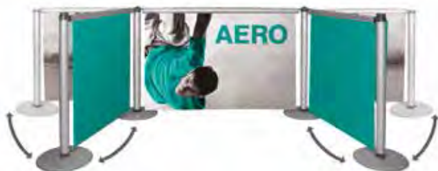
5 Enrouleurs Aero 1000mm - 6 mâts - 6 pieds