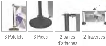
3 Potelets 3 Pieds 2 paires d'attaches 2 Traverses