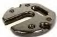
Pied de lestage de 10kg

Taille de la structure en mm (approx)* : 3350 (h) x 2900 (l) x 2900 (p)