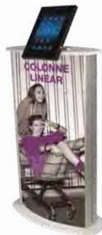
Standard sans LED + Support Ipad 360°