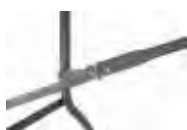
Vérouillage avec anneaux